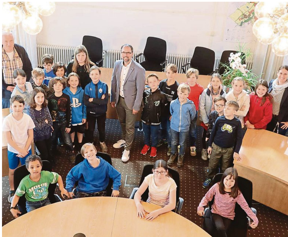
Klasse 4e der Grundschule Olching