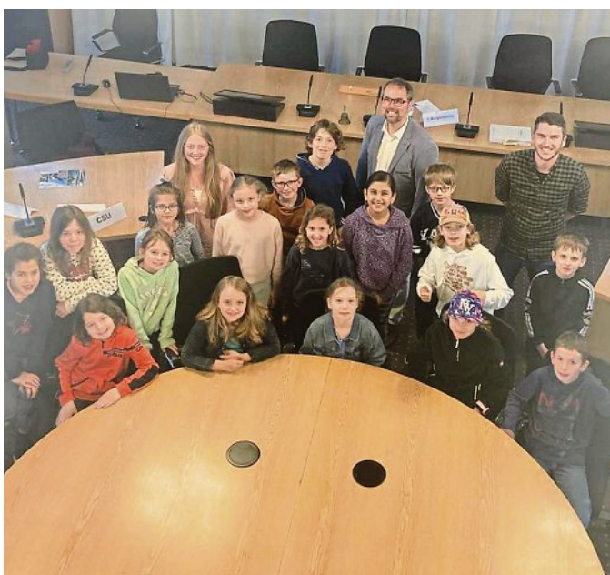
Klasse 4c der Grundschule Olching