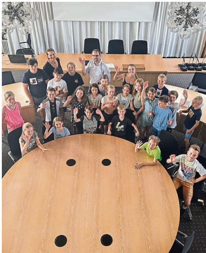
Klasse 4a der Grundschule Graßfing