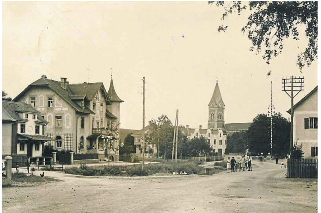
Die Insel um 1930: Links die Brücke beim Fischerpauli, das markante Anwesen „Beim Schwabenschuster“ in der Bildmitte hat sich kaum verändert und steht unter Denkmalschutz. Die für einige Jahre in Ritter-von-Epp umbenannte Hauptstraße wurde 1934 geteert und Bürgersteige wurden angebracht.