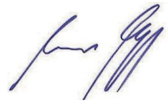
Andreas Magg Erster Bürgermeister