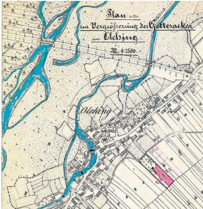
Karte von 1900: Mit den ungebändigten Flüssen Amper, Mühlbach und Schramlbach. Eine geteerte Straße nach Neu-Esting existiert noch nicht. Am Nöscherplatz ist der alte Friedhof der ehemaligen Dorfkirche eingezeichnet