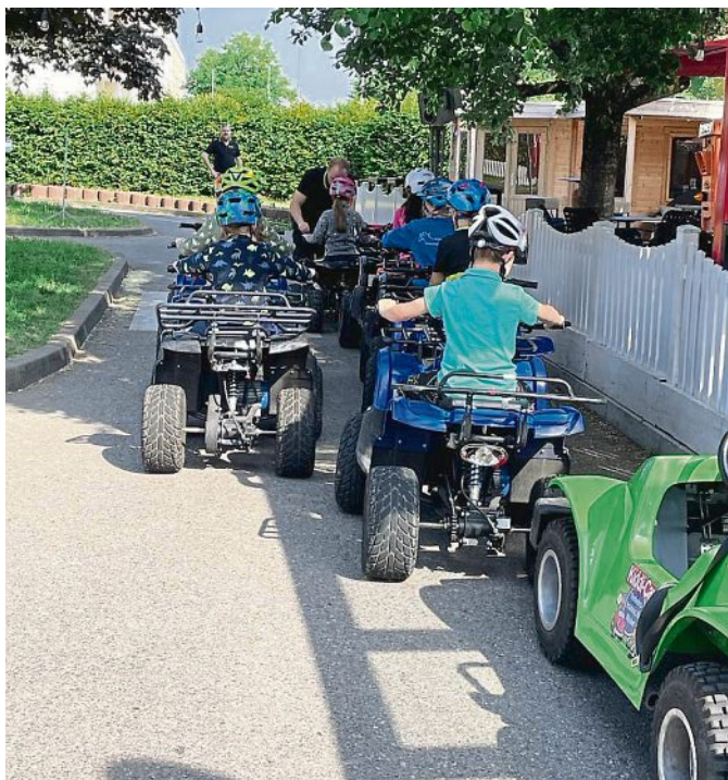
KiddiCar Ausflug in Fürstenfeldbruck

Das Pfingstferienprogramm der Stadt Olching war ein großer Erfolg und bot Schülern eine unvergessliche und bereichernde Ferienzeit. Nun freuen wir uns, den Start des Anmeldeprozesses für unser aufregendes Sommerferienprogramm 2023 bekannt zu geben. Das Pfingstferienprogramm, das vom 27.05. - 11.06.2023 stattfand, bot eine breite Palette an Aktivitäten für Schüler aller Altersgruppen. Die Teilnehmer hatten die Möglichkeit, an Workshops zu verschiedenen Themen teilzunehmen, sportliche Aktivitäten auszuprobieren, kreative Projekte zu verwirklichen und aufregende Ausflüge zu unternehmen. Unter der fachkundigen Anleitung unseres engagierten Teams konnten die Schüler ihre Talente entfalten, neue Freundschaften schlie-