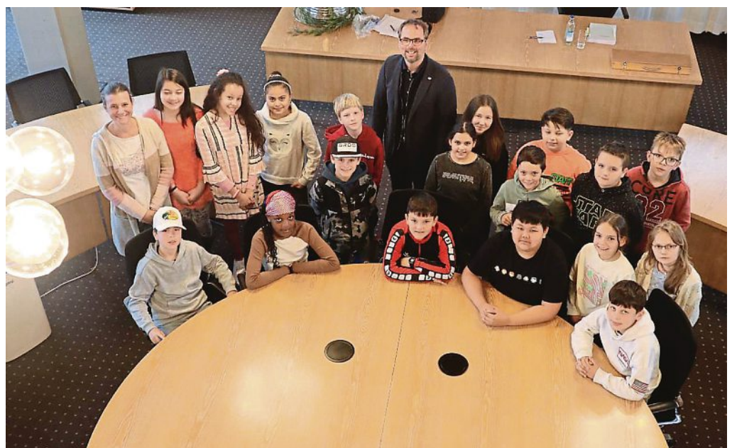
Klasse 4d der Grundschule Olching