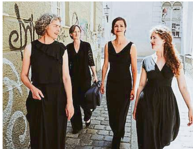
PER-SONAT kommt zur 202. Matinee.